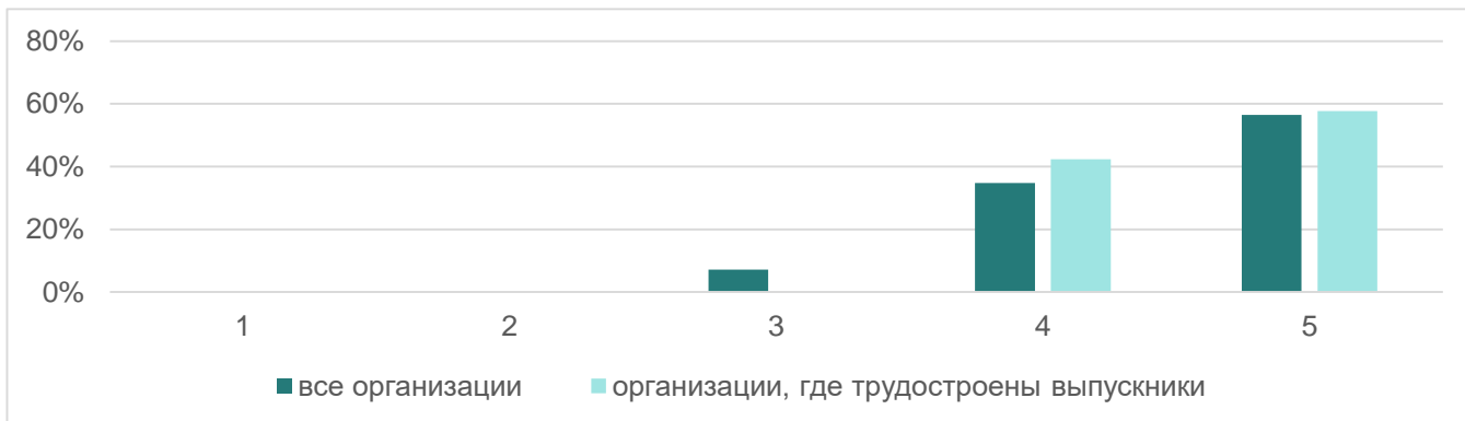
Рис.2. Распределение оценок качества образования в ответах работодателей

Участникам анкетирования было предложено оценить по 5-балльной шкале качество образования. Средняя оценка качества образования, поставленная всеми респондентами работодателями, составила 4,5 балла из 5, средняя оценка, поставленная представителями организаций, где трудоустроены выпускники – 4,6 балла.