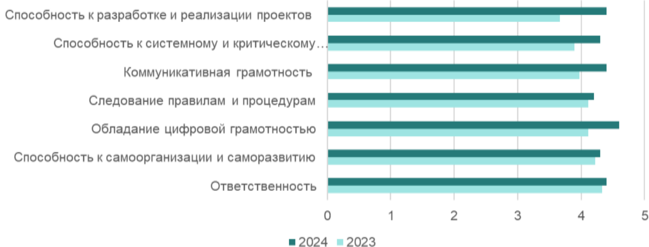
Рис.4. Сравнение оценок профессиональных качеств обучающихся и выпускников СПбГИКиТ