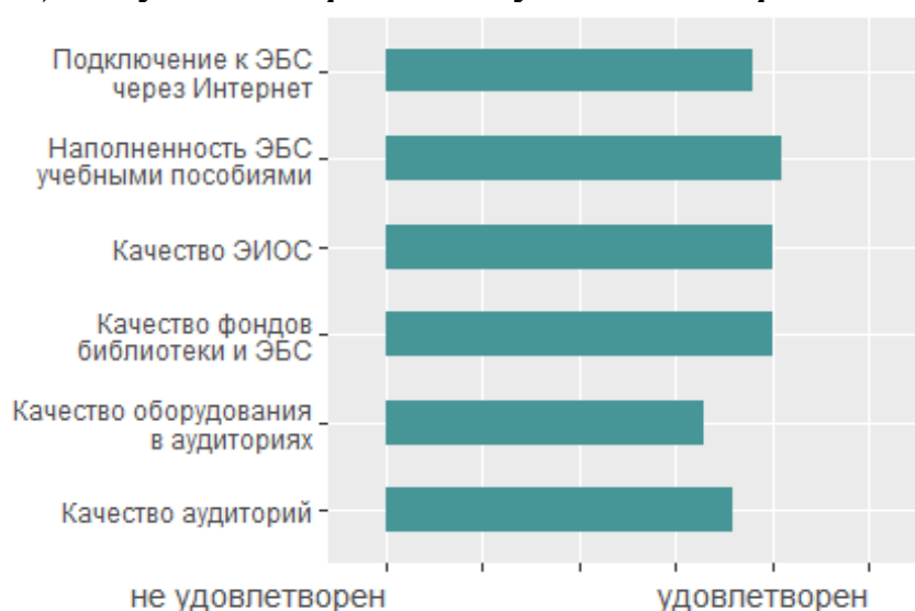
Рисунок 1. Удовлетворенность преподавателей условиями реализации ОПОП